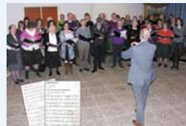
Gemengd koor 'Sursum Corda' uit Zeist tijdens een repetitieavond.

Het mogen foto's zijn van koren (officieel of tijdens een repetitie), impressies van zangavonden (niet alleen het koor, maar ook het publiek) en/of de fotografische weerslag van een verenigingsuitje.